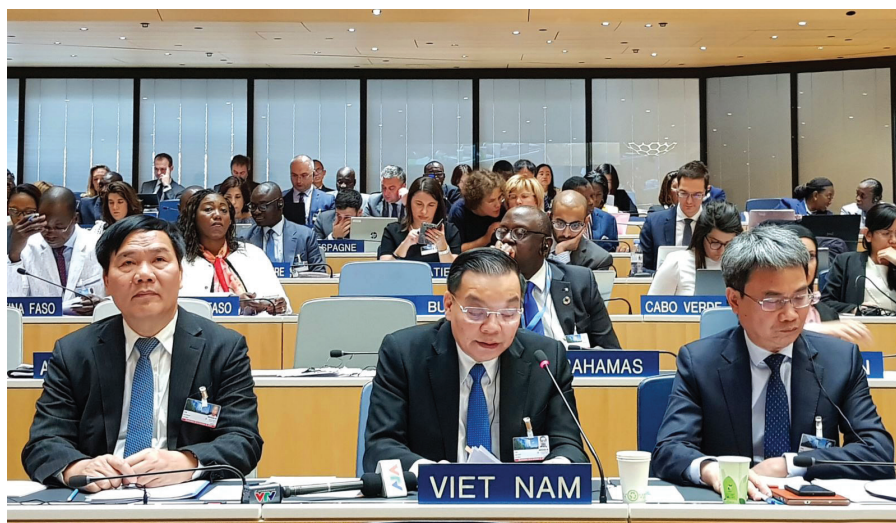
Bộ trưởng Chu Ngọc Anh thay mặt ASEAN và Việt Nam phát biểu tại phiên khai mạc của Đại hội đồng WIPO lần thứ 59 (ngày 30/9/2019).

điều, văn kiện này là thỏa ước quốc tế chính thức đầy đủ, chi tiết và thuận lợi cho việc đăng ký quốc tế KDCN. Văn kiện La Hay 1960 quy định chỉ các quốc gia thành viên của Công ước Paris về bảo hộ quyền SHCN mới có thể gia nhập và các quốc gia có quy định thẩm định nội dung đơn KDCN không được tham gia; các quốc gia thành viên có quyền từ chối bảo hộ KDCN tại lãnh thổ của mình nếu xét thấy không đủ tiêu chuẩn bảo hộ theo pháp luật quốc gia bằng một thông báo cho Văn phòng quốc